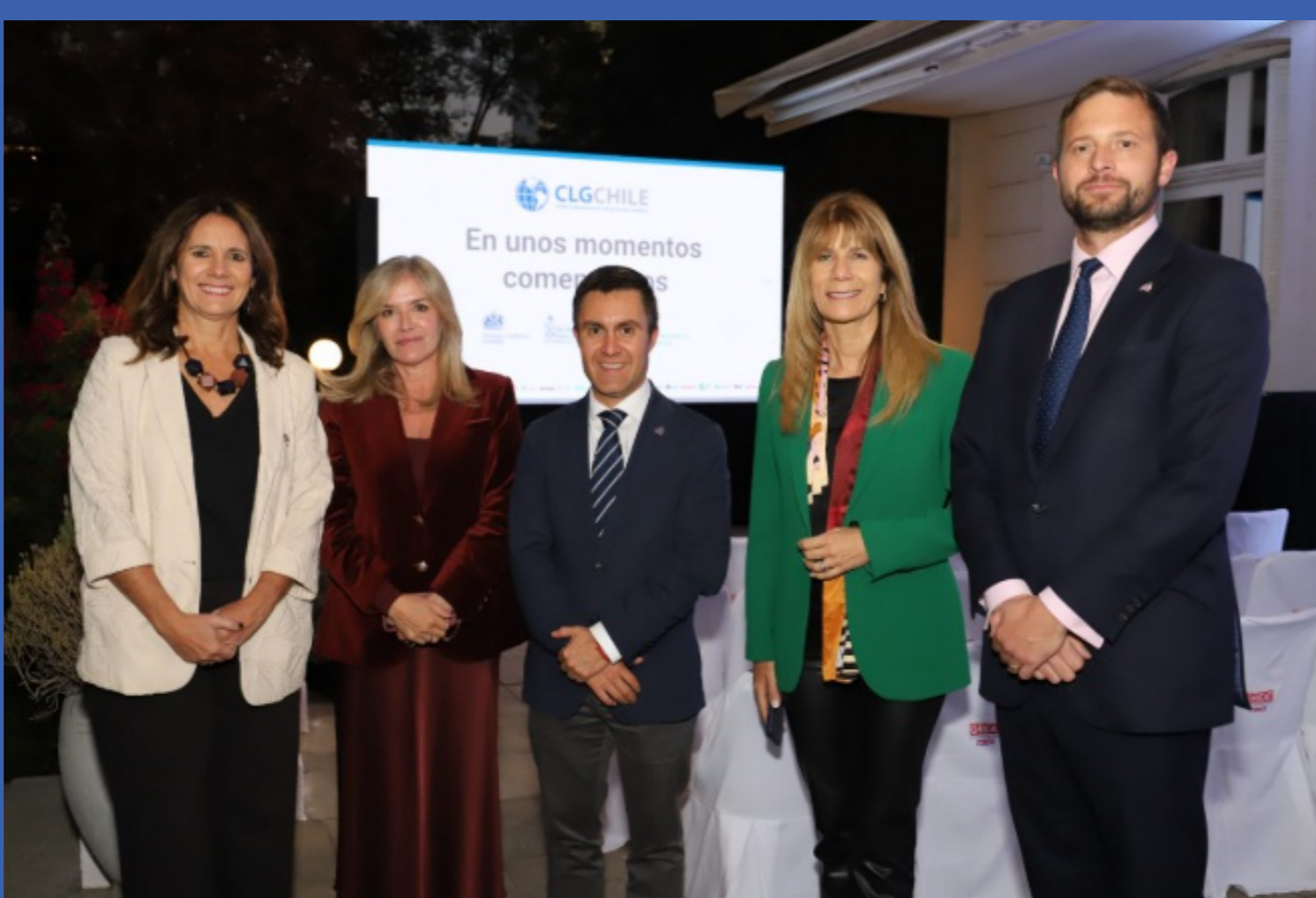
Encuentro Anual de CLG Chile destacó que la transición energética y la acción climática empresarial son una ruta para promover el desarrollo económico y la inversión en nuestro país 09 de abril de 2026