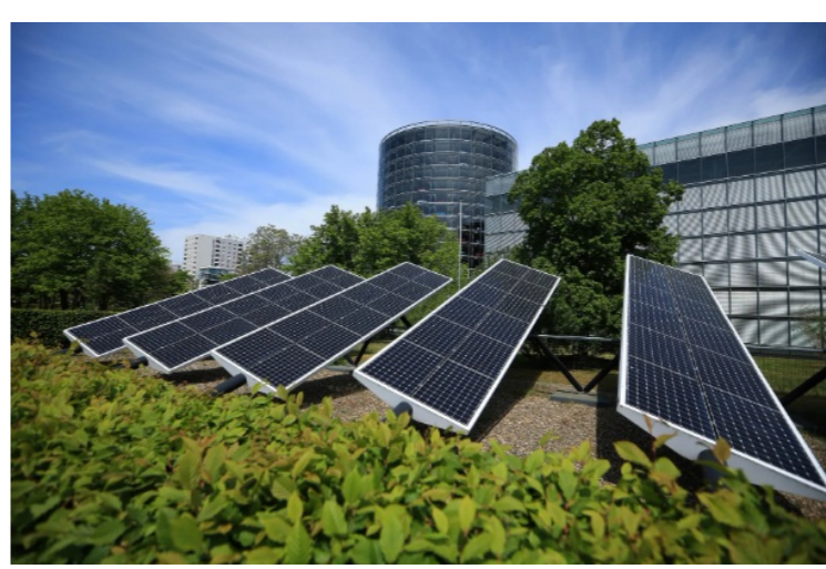
Defense Firms Are Asking EIB for Help Navigating Energy Crisis Bloomberg – 15 de abril de 2026