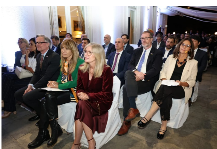
Encuentro Anual de CLG Chile puso el foco en la transición energética como ruta para el desarrollo y la inversión Fen Uchile – 15 de abril de 2026