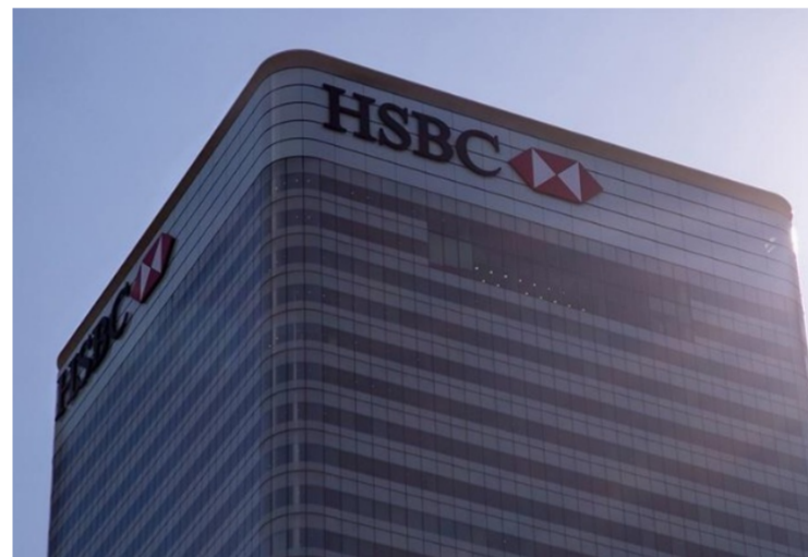
HSBC Launches $4 Billion Facility to Help China Clean Tech Companies Scale Internationally ESG Today – 18 de mayo de 2026