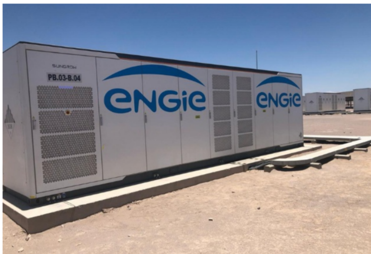
VII Premios Cero Basura: Ecológica reconoció a ocho innovaciones por su aporte a la economía circular en Chile Pacto Global Chile – 19 de mayo de 2026