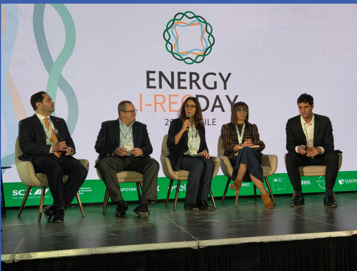
Directora ejecutiva de CLG Chile moderó panel sobre el mercado de carbono y las finanzas climáticas en el Energy I-REC Day Chile 19 de mayo de 2026