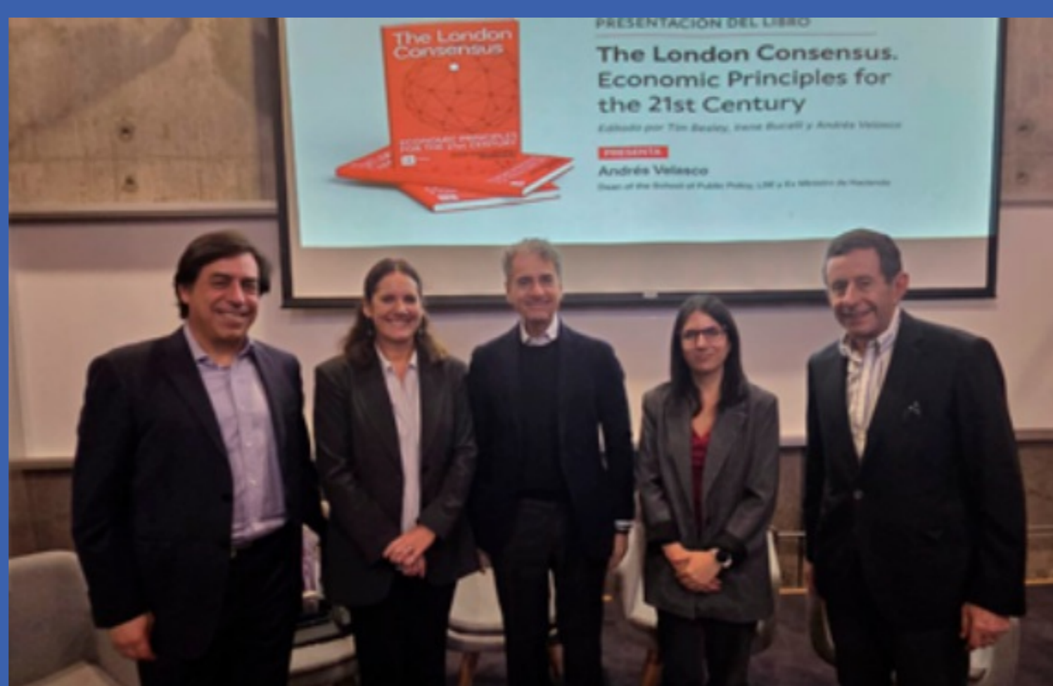
Directora Ejecutiva de CLG Chile participó en la presentación del libro The London Consensus, Economic Principles for the 21st Century 20 de abril de 2026