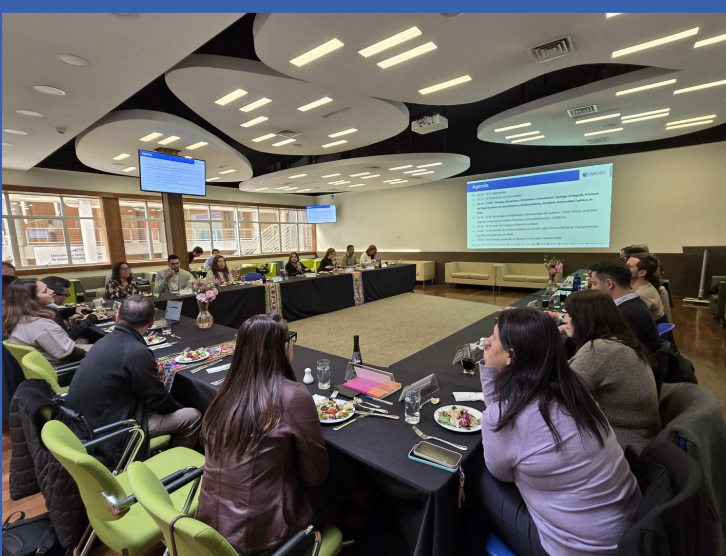
Steering Committee CLG Chile mayo 2026 28 de mayo de 2026