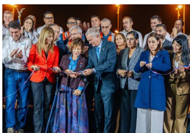
El Teniente pavimenta con residuos mineros y neumáticos reciclados Reporte Minero & Energético – 17 de junio de 2026